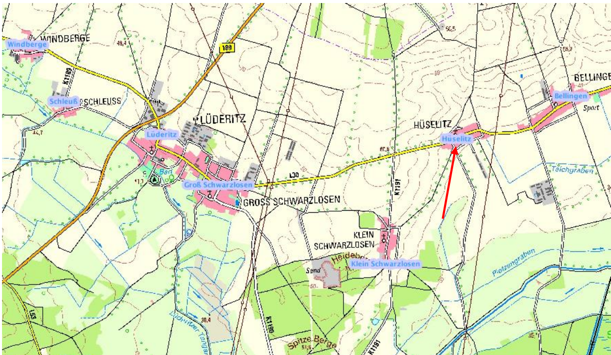
Lageplan auf der Grundlage der topographischen Karte TOP 50 des LVermGeo LSA

Lage: Die Ortschaft Hüselitz liegt im nördlichen Teil der Einheitsgemeinde Stadt Tangerhütte. Da sich die Bundesstraße 189 in der Nähe befindet, sind alle umliegenden Städte/Ortschaften schnell zu erreichen. Im Zuge des geplanten Ausbaus der A 14 wird es eine Autobahnabfahrt in der benachbarten Ortschaft Lüderitz geben.